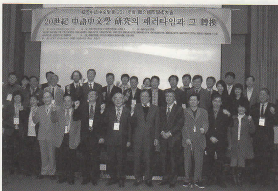
第2日目(崇實大学)開会式後の記念写真

今回の東亞現代中文文学学会は、一部日程を国内学会に取り込む形で行われたが、この試みは韓国でも余り例がない由で、一部はハングルと中国語が入り乱れ、困惑する場面もあったが、おおむね成功していた。今後は日本でも会議のテーマによっては積極的に中国語を公用語とし、国際的に開かれた会議にしてゆくべきであろう。