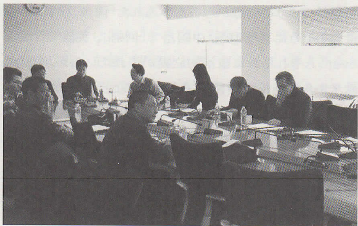
儒教ワークショップ参加者

※文中では敢えて繁雑を避けず、各発表者の用語法に従って「儒教」「儒学」「儒家」の3語を使い分けた。“Confucian revival”という現象に対する発表者の認識を反映して、こうした違いが生じた場合もあろうし、或いは“Confucian revival”の当事者による語彙の選択を、そのまま反映した場合もあるだろう。